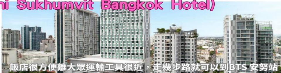
飯店很方便離大眾運輸工具很近，走幾步路就可以到 BTS 安努站